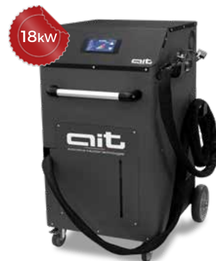
ART - HDi 18K400 TC