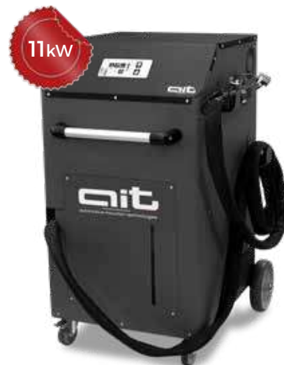
ART - HDi 11K230 KB