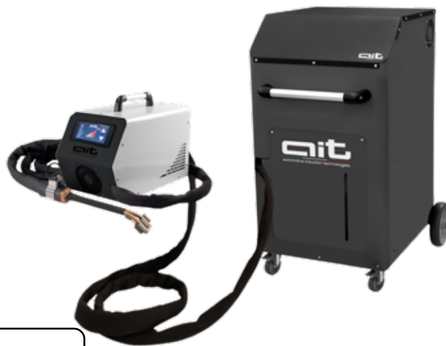
ART - HDi 16kW Runner