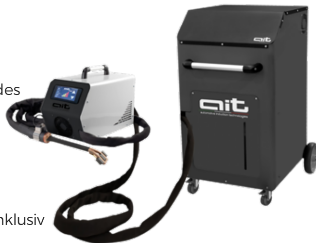
ART - HDi 16kW Runner