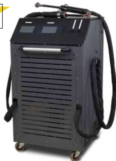
ART - HDi 11-11kW Biductor