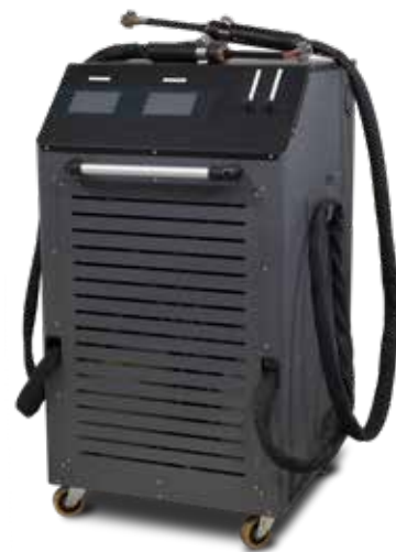
ART - HDi 11-11kW Biductor