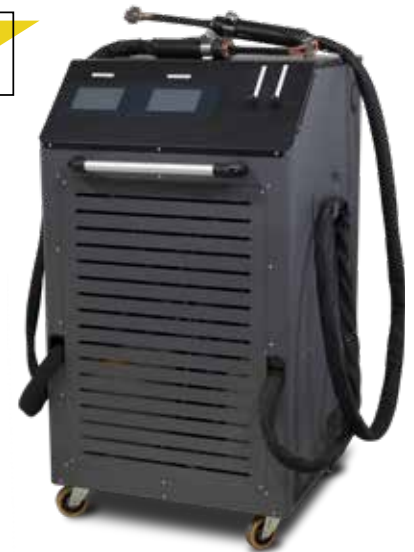
ART - HDi 11-11kW Biductor