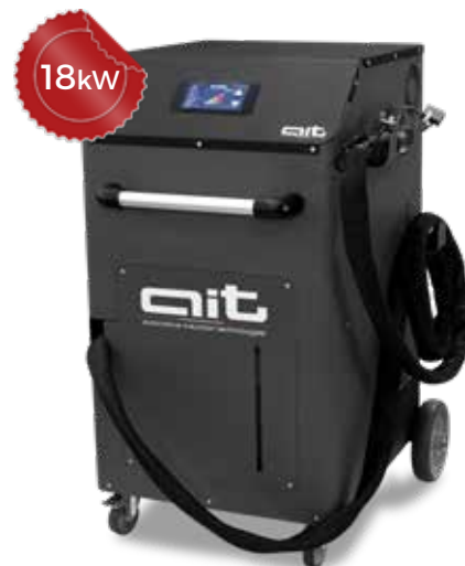
ART - HDi 18K400 TC