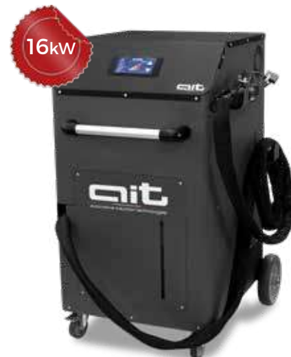
ART - HDi 16K400 TC