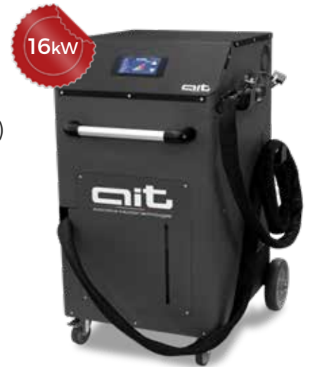
ART - HDi 16K400 TC