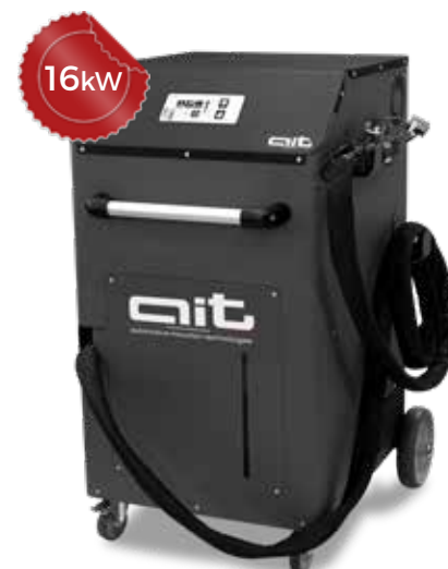
ART - HDi 16K400 KB