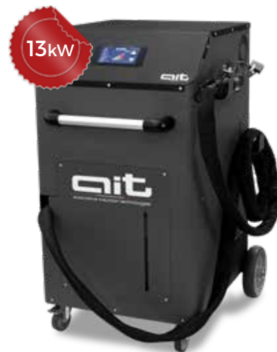
ART - HDi 13K230 TC