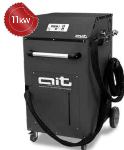
ART - HDi 11K400 KB