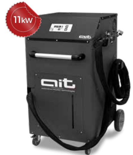
ART - HDi 11K400 KB