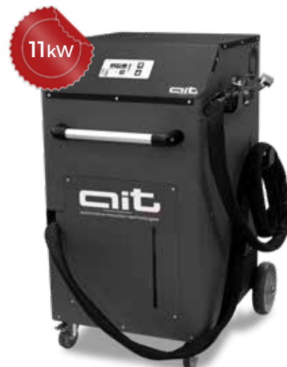
ART - HDi 11K230 KB