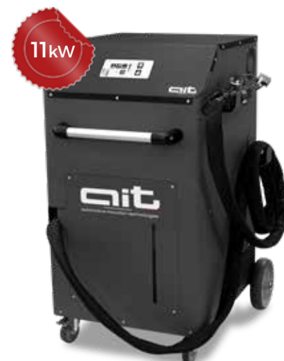
ART - HDi 11K230 KB